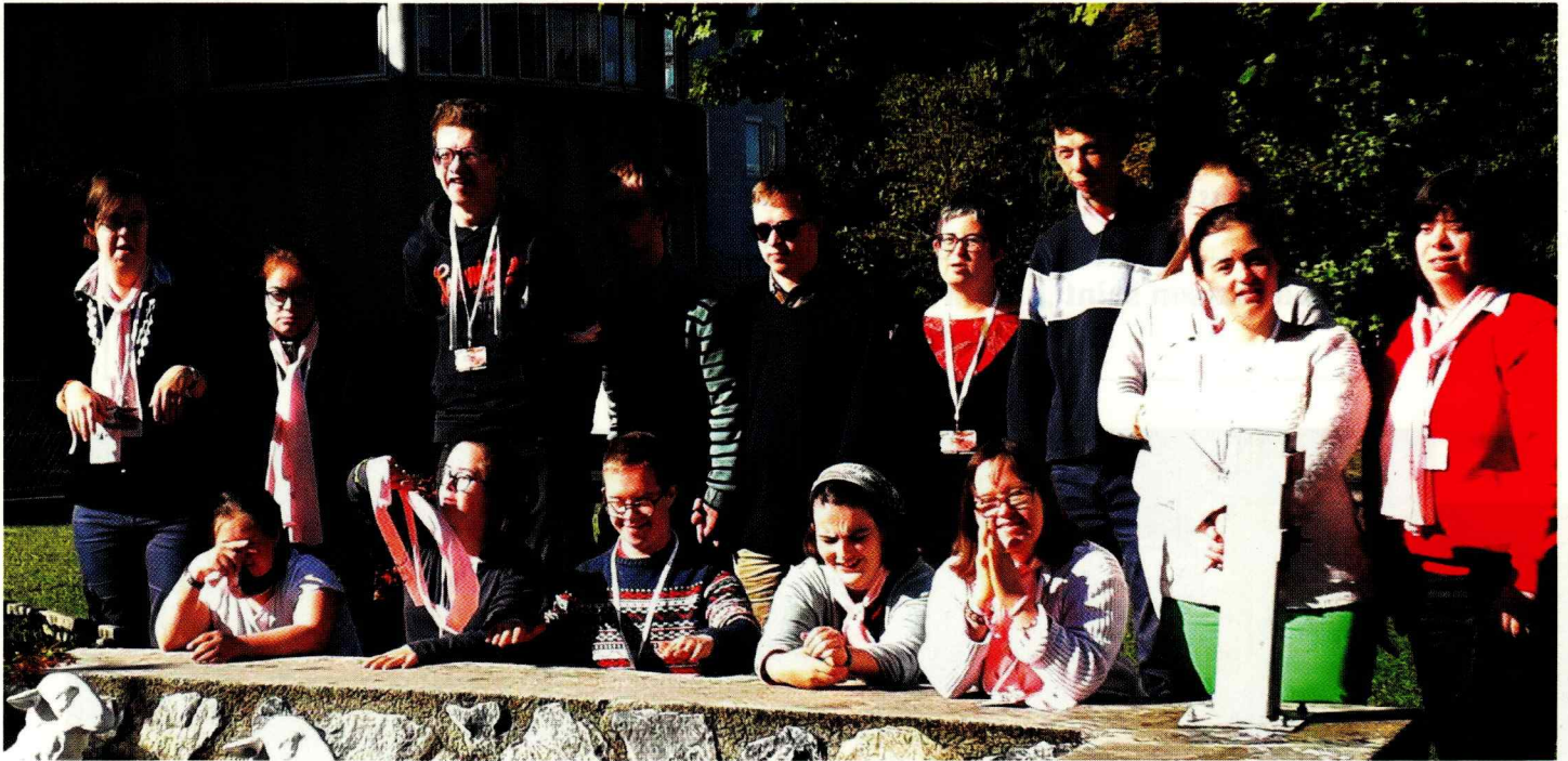
Nos pèlerins du Rosaire avec leurs amies de La Ruche

La maison Saint Jean-Paul II (41 rue Pierre Corneille-VERSAILLES)