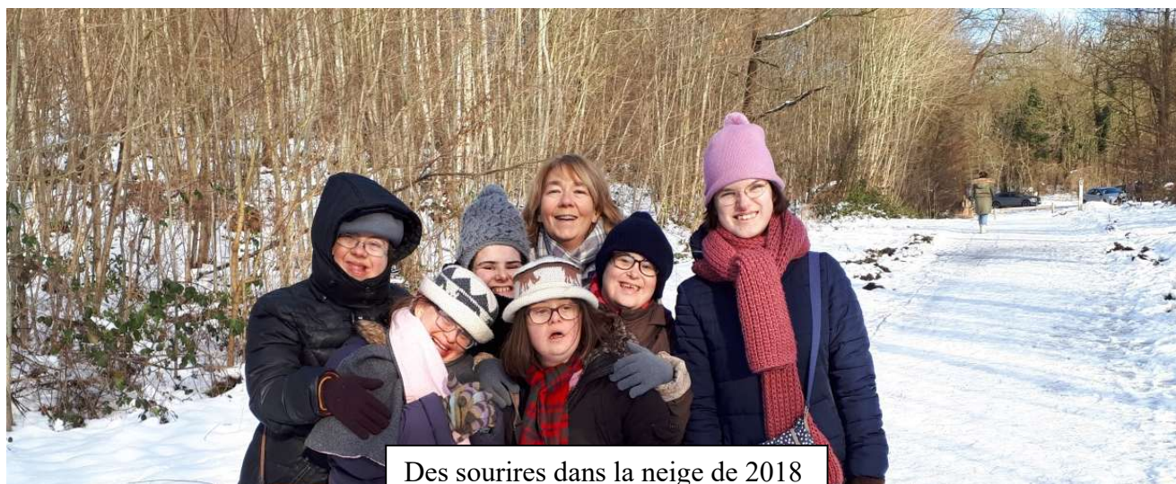
Des sourires dans la neige de 2018

« Les week-ends d'hiver sont plus centrés sur différents ateliers créatifs (vitraux, masques de carnaval...) et les visites culturelles, comme « verre et lumière » une exposition d'œuvres transparentes et fragiles faisant danser la lumière. Nous avons eu la joie d'assister à la comédie musicale « Sainte Hildegarde » et avons apprécié les chorégraphies et les chants !