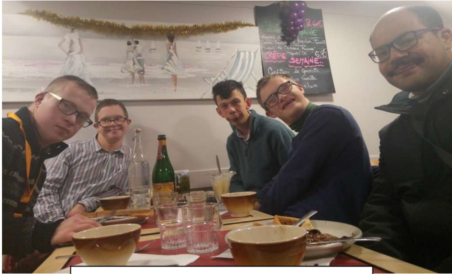
Petit passage à la crêperie pour fêter Noël !

« Nous aimons passer le week-end à la Maisonnée : Le vendredi, nous nous retrouvons tranquillement autour du goûter avant de faire un baby-foot ou un billard.